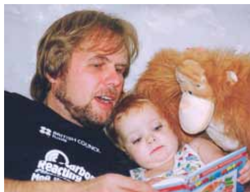
Почитай мне, пожалуйста!

Если мы говорим о возрасте от нуля до трех (имея ввиду не мамыны колыбельные, стишки, потешки, первые сказки, а именно