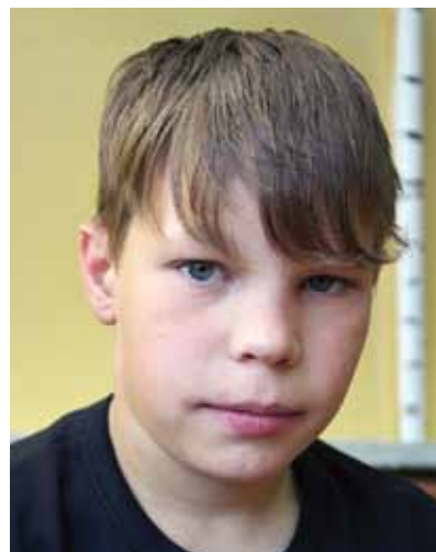
Сереза 12 лет

Спокойная, любознательная, исполнительная и чуть-чуть стеснительная девочка. Любит рисовать, слушать музыку, смотреть фильмы. Ей нравится вышивать. Она спортсменка, занимается в ДЮСШ в секции легкой атлетики. В школу ходит с удовольствием, очень ответственно относится к выполнению домашнего задания.