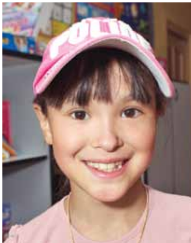
Айта 9 лет

Любит быть в центре внимания, увлекается рисованием, любит ухаживать за растениями и шить бисером. Подвижная активная девочка.