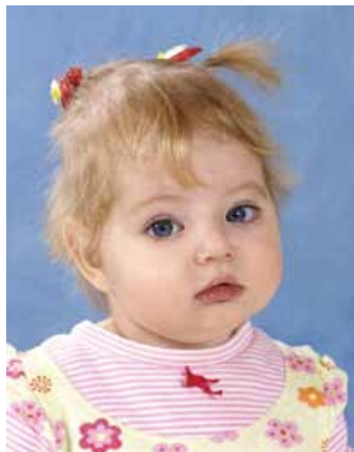
Виктория июль 2010 г.