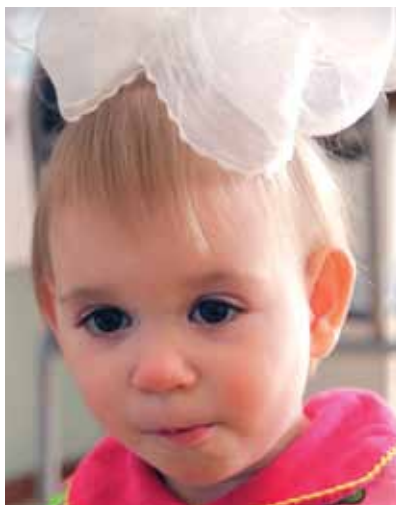
Виктория октябрь 2010 г.

Виктор с интересом познает окружающий мир, рассматривает незнакомые предметы, пытается их потрогать. На прогулках любит разглядывать прохожих, машины.