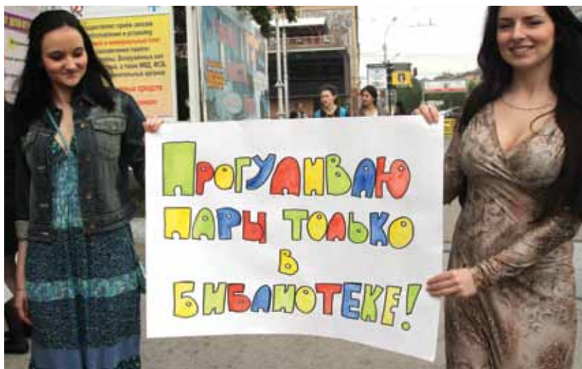
Акция студентов НГПУ в защиту русского языка и литературы